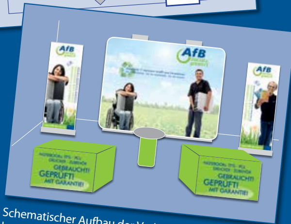
Schematischer Aufbau der Verkaufsfäche, benötigte Fläche mindestens 30 m 2 .