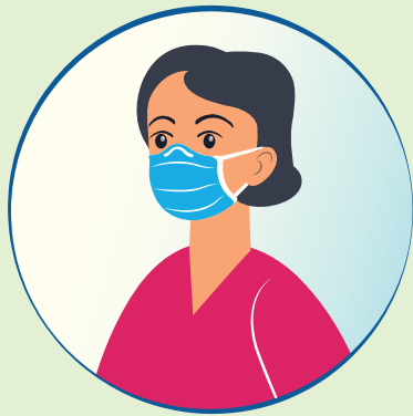
Maskenpflicht (OP- oder FFP2-Maske)

Bitte haben Sie dafür Verständnis, dass aufgrund der aktuellen Bestimmungen nur die maximale Anzahl an zulässigen Personen pro Quadratmeter den Shop betreten dürfen.